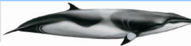
Baleenoptero azzurro ( Balaenoptera acutorostrata )