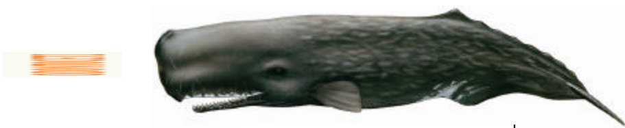
Capodoglio ( Physeter catodon )