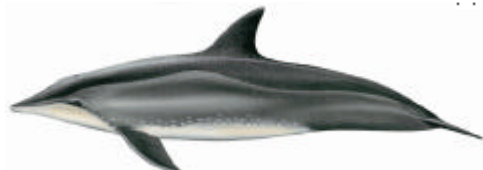
Steno ( Steno bredanensis )