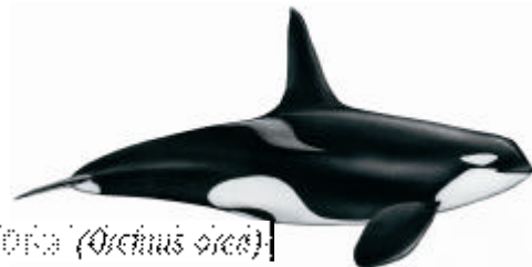
Orca ( Orcinus orca )