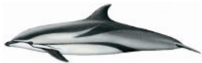
Stenella striata ( Stenella coeruleoalba )