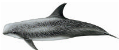
Grampo ( Grampus griseus )