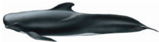
Capodoglio ( Globicephala melas )