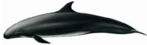
Pseudorca ( Pseudorca crassidens )