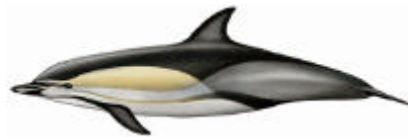
Delfino comune ( Dolphus delphis )