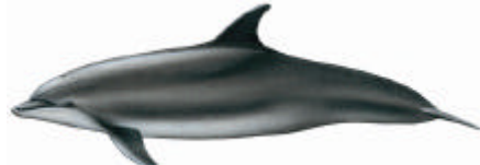
Finipode ( Tursiops truncatus )