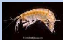
Fig. 1 Corophium orientale (Schellenberg, 1928)

Gli organismi così campionati sono stati inviati ai laboratori partecipanti (Tab. 1) in contenitori in PVC contenenti acqua e sedimento del sito di campionamento. Una volta arrivati nei laboratori gli organismi sono stati posti per 24h in camera termostata alla temperatura di esecuzione del test ed in presenza di areazione. Il giorno successivo all'arrivo degli organismi è stata avviata la fase di acclimatazione alla salinità di esecuzione del test con acqua di mare naturale filtrata a 0,45 µm (35±2‰); l'aumento giornaliero medio della salinità è stato all'incirca del 5%. La sostanza tossica di riferimento utilizzata è stato il cadmio (Cd(NO 3 ) 2 ·4H 2 O, soluzione standard per assorbimento atomico 1000 mg/l in Cd), come suggerito dal protocollo ISO 2005.